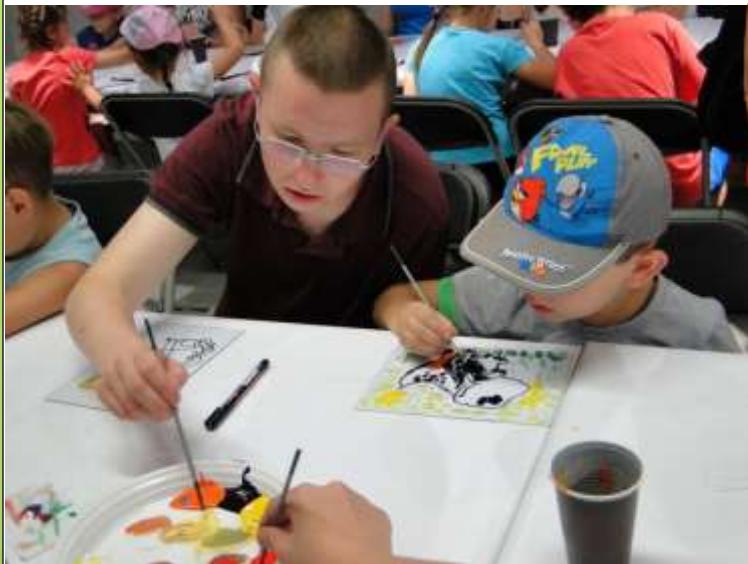
Centrum Dziedzictwa Szkła w Krośnie